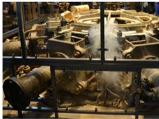
Slipemaskin fra "Levende fabrikk"