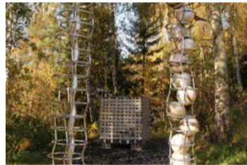
Slektstrea, Genbanken (2013)