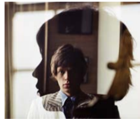
Mick Jagger, London 65